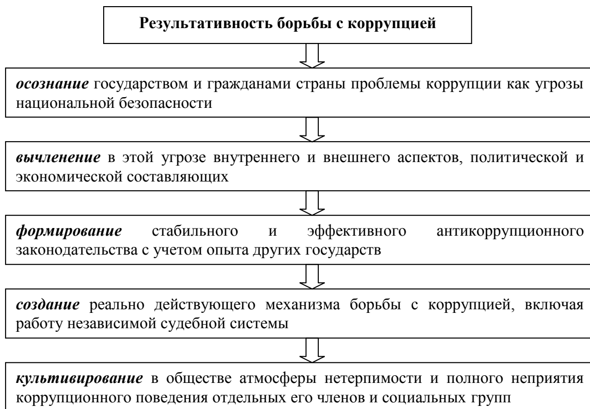
Схема 2. «Цепочка результативности» борьбы с коррупцией

Вместе с тем международный опыт борьбы с коррупцией показывает, что успех в ней зависит от целого ряда факторов, но в целом своеобразная «цепочка результативности» может быть представлена следующим образом (см. схему 2).